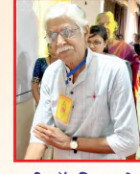
पद्मश्री डॉ. किरण सेठ जी