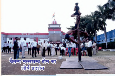
चैतन्य मल्लखम्ब टीम का शौर्य प्रदर्शन

उपलब्धि- 200 से अधिक छात्र-छात्राओं ने राष्ट्रीय स्तर की प्रतियोगिताओं में भाग लेकर कॉलेज को गौरव प्रदान किया।