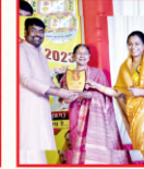
श्रीमती बासंती वैष्णव अंतर्राष्ट्रीय छागिल्लख कलकत्ता नृत्यगणना (विलासपुर)