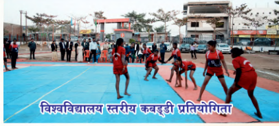
विश्वविद्यालय स्तरीय कबड्डी प्रतियोगिता