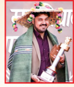
पद्मश्री अनुज शर्मा जी