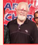
कैन्ट डिकरूजन (अमेरिकी लेखक)