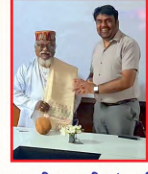
पद्मश्री भारती बंधु जी